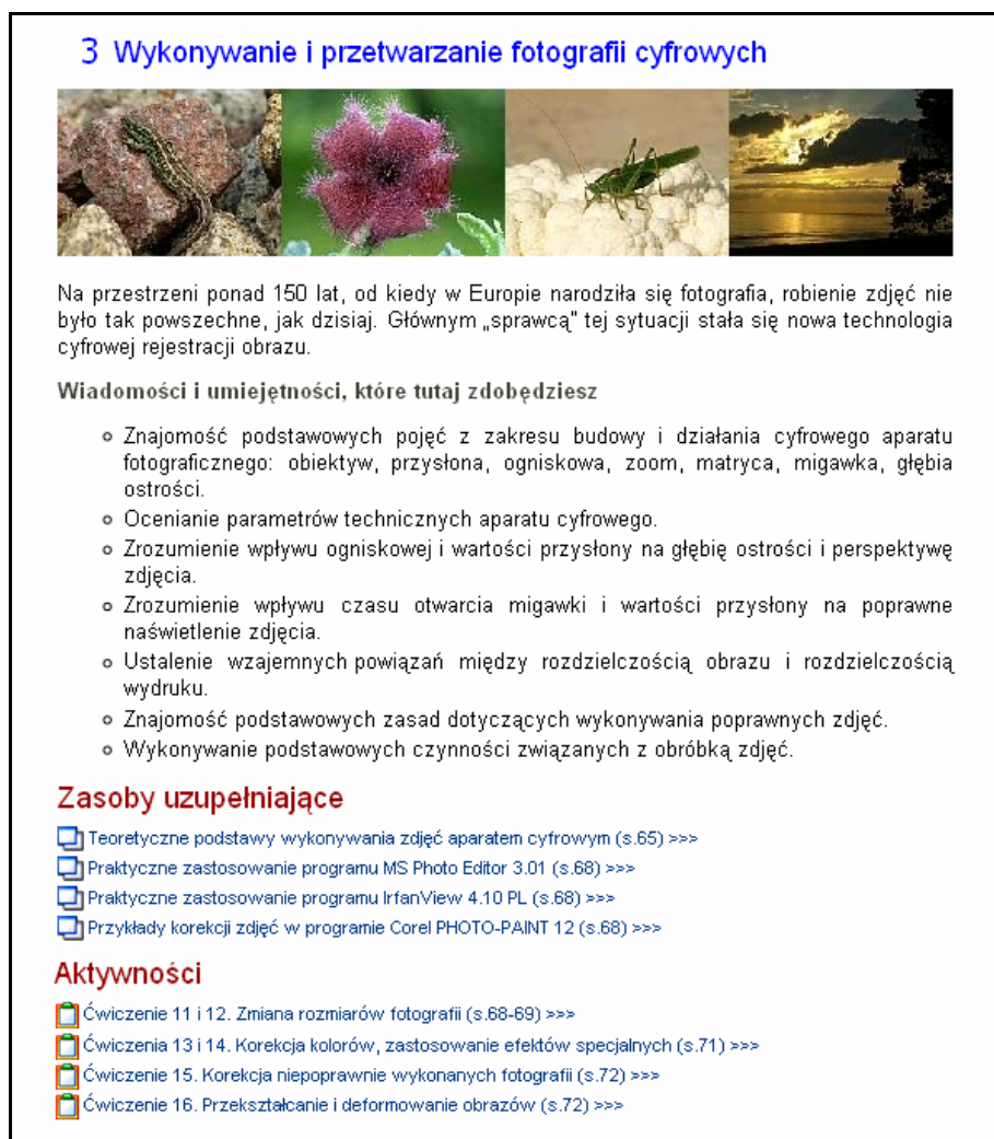
Rys. 2. Druga warstwa przekazu